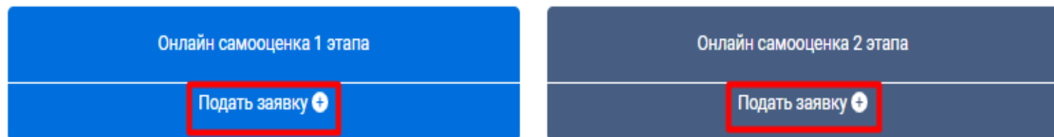
Мои заявки на оценку